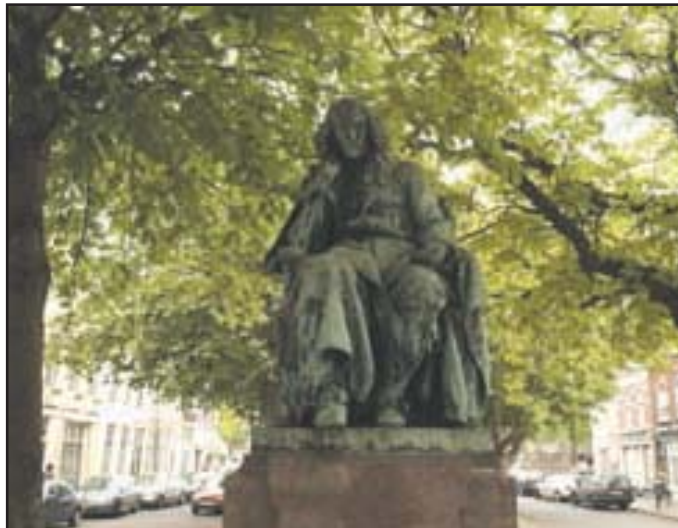
foto: Spinoza onder de bomen van de Paviljoensgracht